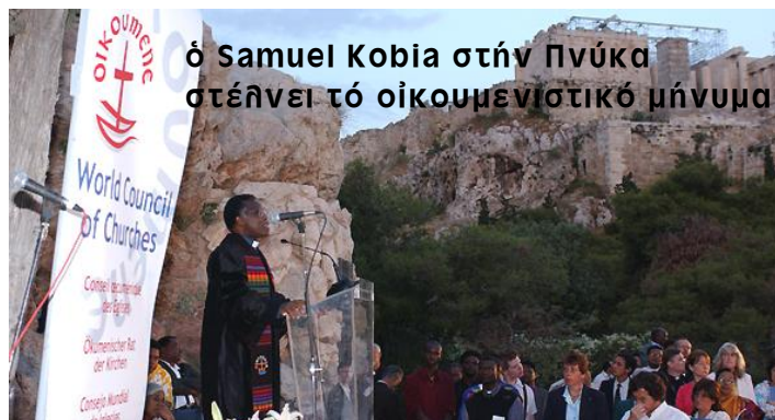
ὁ Samuel Kobia στήν Πνύκα στέλνει τὸ οἰκουμενιστικὸ μήνυμα

(Σημ. Στὸ βιβλιοπωλεῖο "Βασιλεύουσα" τηλ. 210 3244197, διατίθεται σχετικὸ DVD.)