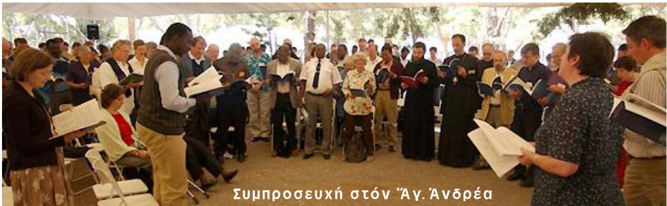
Συμπροσευχή στόν "Άγ. Άνδρέα