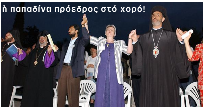
ἡ παπαδίνα πρόεδρος στό χορό!