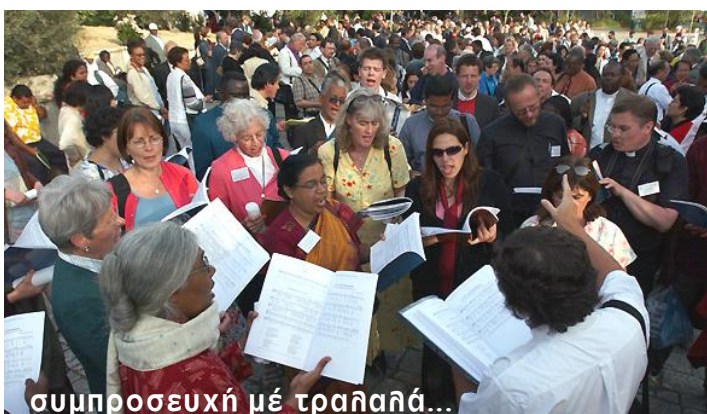
συμπροσευχὴ μέ τραλλαῖά...