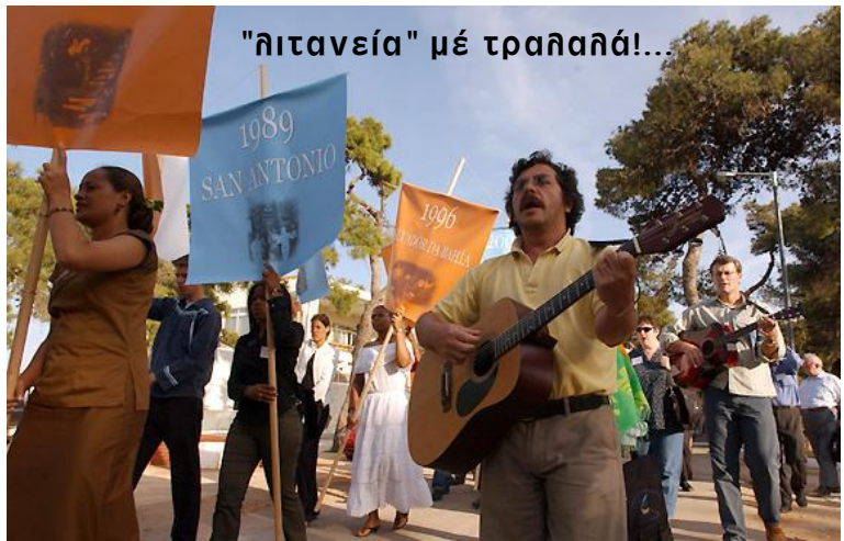
"ήιτανεία" μέ τραηαλά!...