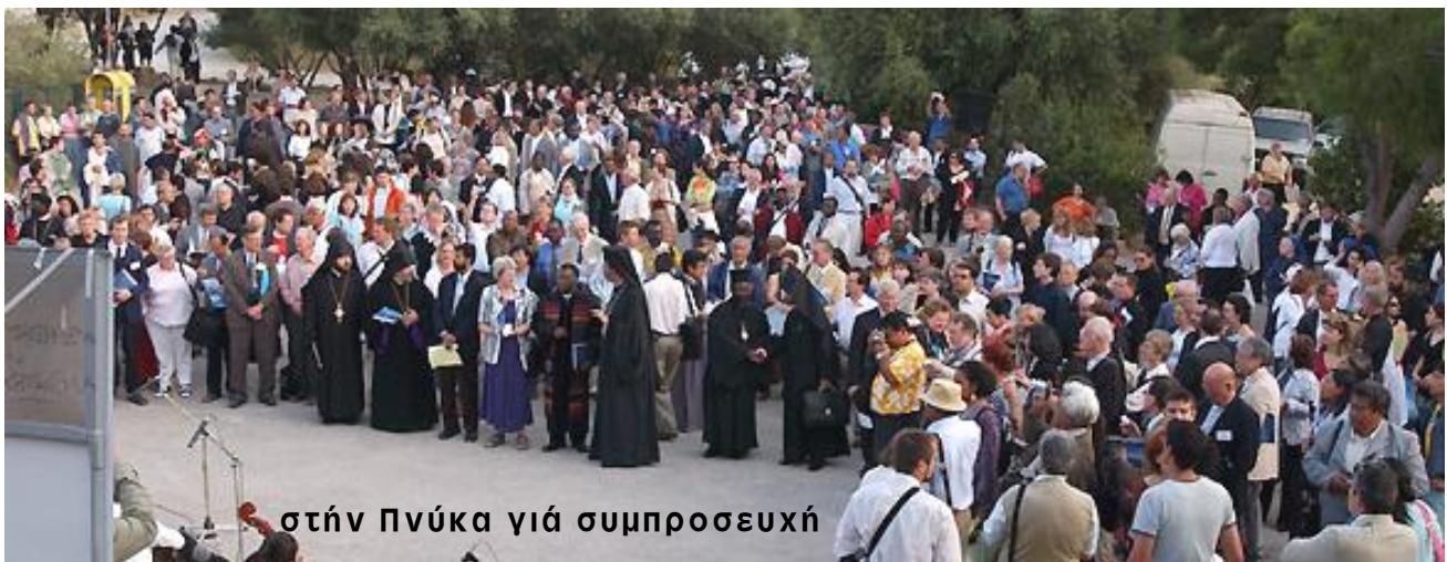
στήν Πνύκα γιά συμπροσευχή