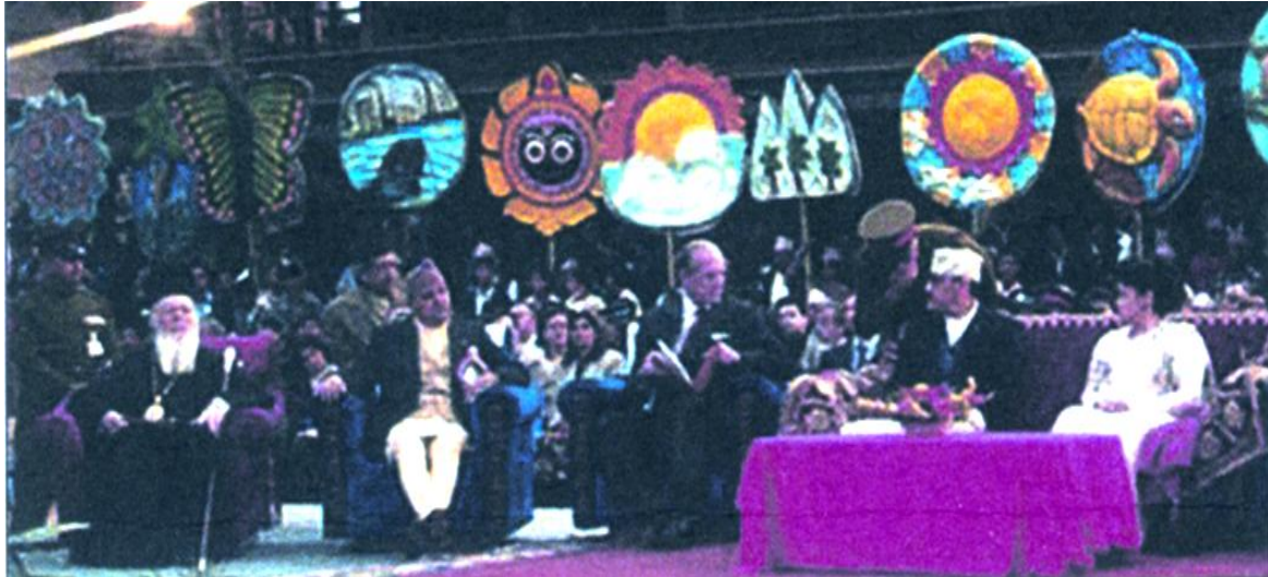
Νοέμβριος 2000, Στό Κατμαντοϋ του Νεπάλ ὁ κ.Βαρθολομαῖος συμμετέχει σέ διαθρησκειακές-εἰδωλολατρικές δαιμονικές τελετές γιά τή "Μητέρα Γῆ"...

Σέ λόγους του ὁ ἀσεβής κ. Βαρθολομαῖος ἐξίσωσε τήν Θεόπνευστη Ἁγία Γραφή μέ τό Κοράνιο, ἀνέτρεψε τό Ἱερό Εὐαγγέλιο λέγοντας ὅτι αἱ ἐντολαί του Θεοῦ ἔχουν προσωρινή ἰσχύ καί ἔβρισε ὡς "τείχη αἰσχύς" τούς Ἱερούς Κανόνες, καί ὡς «θύματα τοῦ ἀρχεκάκου ὄφεως» τούς Ὁμολογητές Ἁγίους Πατέρες μας, πού ἀντιστάθηκαν στήν προδοτική ἔνωση μέ τοὺς Παπικούς. Ἐπίσης ἔχει προτείνει τήν κατάργηση τῶν Ἱερῶν Κανόνων πού ἀπαγορεύουν τίς συμπροσευχές μέ αἰρετικούς ( "Ἅγιος Ἀγαθάγγελος" τ.196, σ.15, καί 201, σ.7, "Ἐκκλησιαστική Ἀλήθεια" 16/12/98, "Σταυρός" τ.491 ).