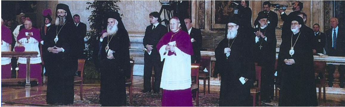
29/11/2004, Βαρθολομαῖος, Πάπας, Φαναριῶτες, Ἄνθιμος Ἀλεξανδρουπόλεως, καί Καρδινάλιοι συμπροσεύχονται στό "Ναό τοῦ Ἁγίου Πέτρου"...

Βλέποντας οἱ οἰκουμενιστές τήν ἀντίσταση τῶν Ζηλωτῶν Πατέρων, ἔθεσαν σέ ἐνέργεια πρό ἐτῶν πανοῦργο σχέδιο , γιά νά τούς ἐκδιώξουν ἀπό τό Ἅγιον Ὄρος. Τό προδοτικό Φανάρι ἔβαλε ὡς στόχο τούς Ἐσφιγμενῖτες. Καί, ἐνῶ ἀναγνωρίζει ὡς "ἀδελφές Ἐκκλησίες" τούς αἰρετικούς, ὅμως κήρυξε σχισματικούς τούς ὀρθόδοξους Ἐσφιγμενῖτες, δίνοντας ἔτσι τό ἐπιχείρημα στό Κράτος γιά νά τούς ἀπελάσει.