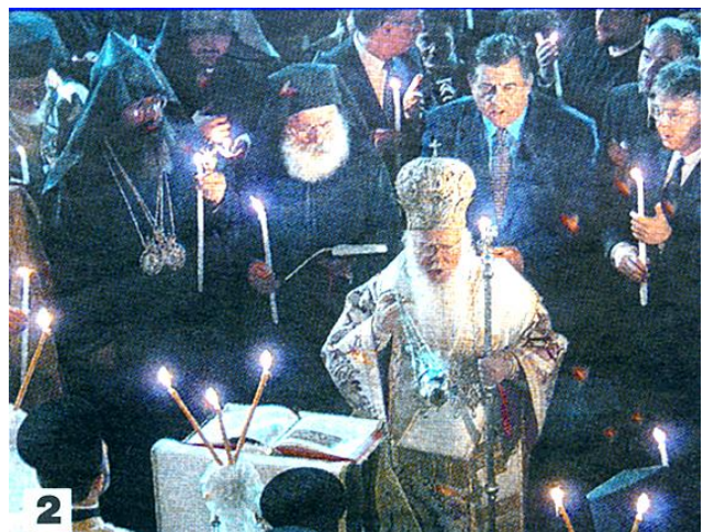
Ὁ κ.Βαρθολομαῖος συμπροσευχόμενος μέ Μονοφυσῖτες τήν ἡμέρα τοῦ Πάσχα.