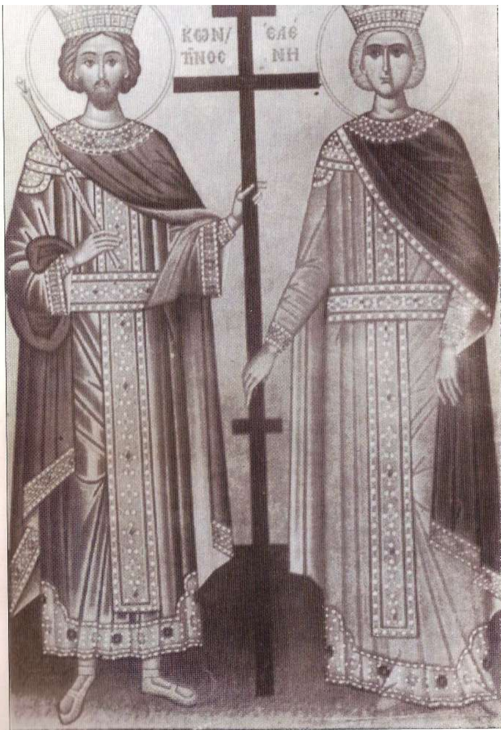
Οἱ Ἅγιοι Κωνσταντῖνος καί Ἑλένη