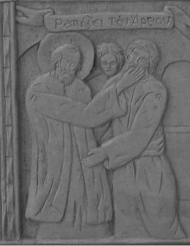
Ρατίζει τὸν ἄραον