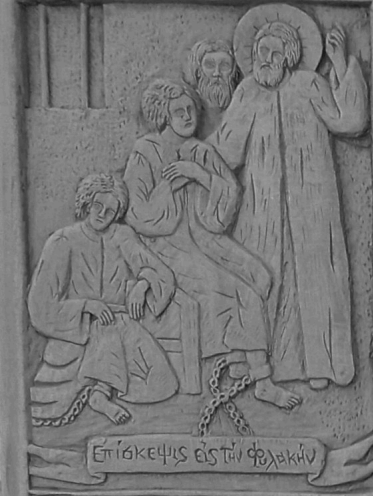
Ἐπίσκεψις εἰς τὴν φελακίαν