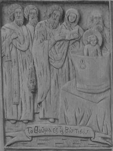
Το θαύμα εἰς τὴν Βηθαθαίαν