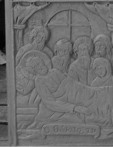
Ὁ θάνατος το