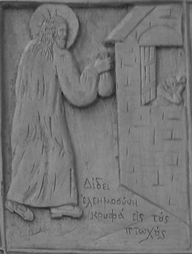
Δίδει ἐκ νεφελῶν κροφά εἰς τοὺς πτωχοὺς