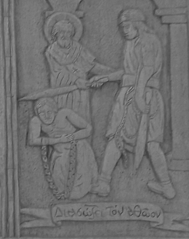
Διδόσκει τὸν ὄραον