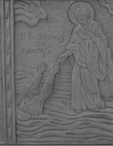
Ἡ διδασκαλία το