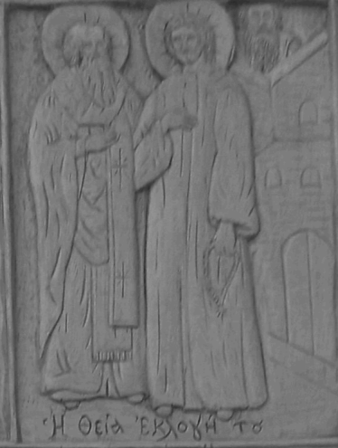
Ἡ οὐρα ἔκδοξή το