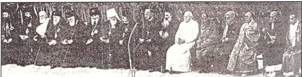
Παναριετικοὶ οἰκουμενισταὶ συμπροσεύχονται τὸ 1986 εἰς πλατεῖαν τῆς Ἀσσίζης Ἰταλίας πρὸς τὸν Διάβολον, διὰ νὰ τοὺς ἐνώση σατανοκρατικῶς ὑπὸ τὸν ἀντίχριστον Πάπαν!