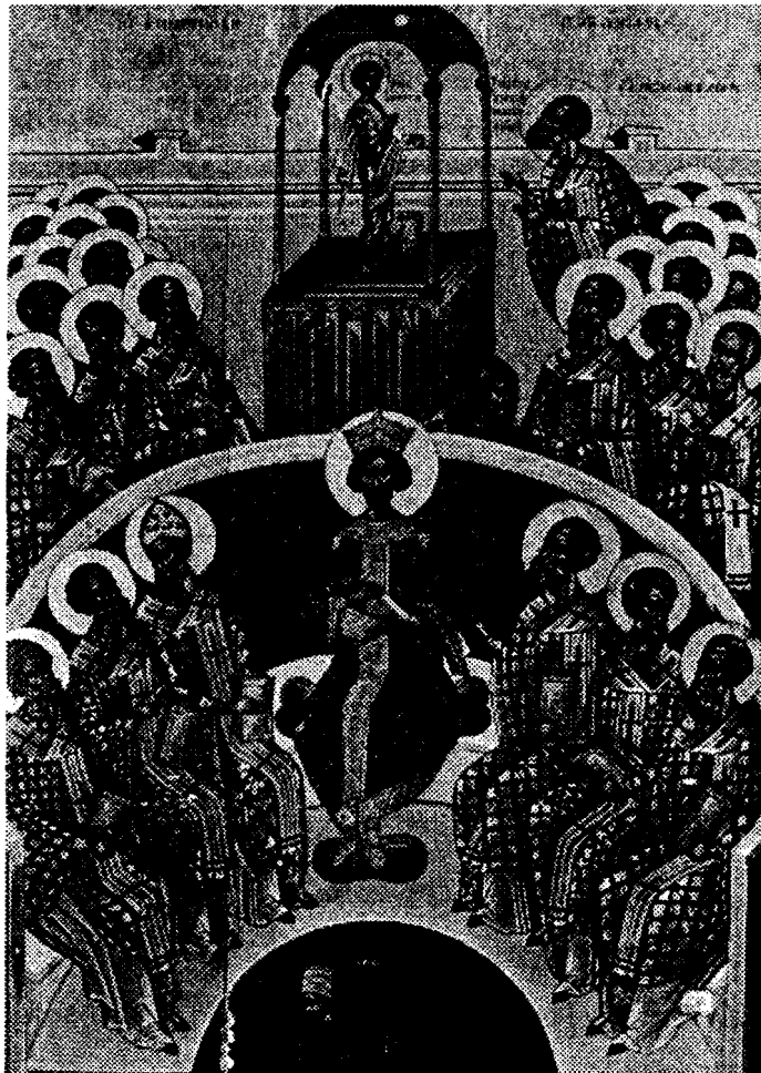
Ἡ Ἁγία καί Οἰκουμενική πρώτη Σύνοδος.