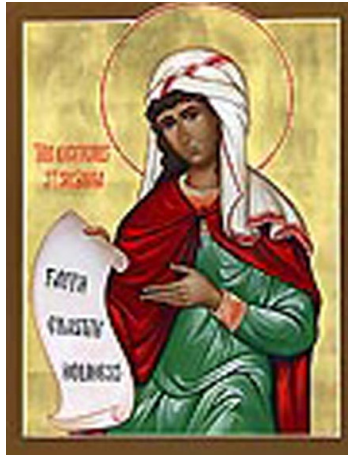
Η Οσία Άννα (εικόνα της Ρωσικής Εκκλησίας)

Ο βίος της «όσιας Άννης τῆς ἐν τῷ Λευκάτῃ» ὡπως αναφέρεται στην ημερομηνία 23 η Ιουλίου στο Συναξάριον της Εκκλησίας της Κωνσταντινουπόλεως 1 (ένα κείμενο του 10 ου αιώνας μ.Χ.) είναι ο ακόλουθος: