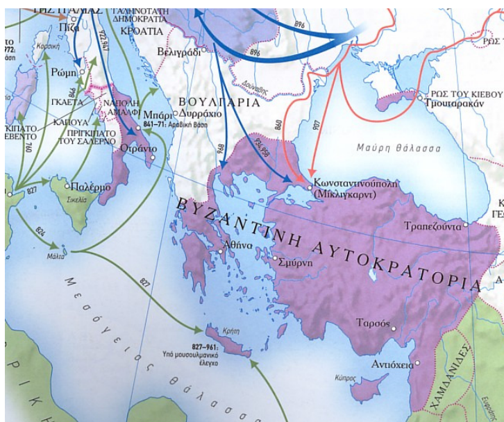
Η Βυζαντινή Αυτοκρατορία μεταξύ του 800 και του 1000 μΧ. Οι ισλαμικές κτήσεις είναι με πράσινο χρώμα. vi

τον «Αγαρηνό», καθώς οι περιοχές αυτές υπέφεραν από Αραβικές επιδρομές την εποχή του αυτοκράτορος Βασιλείου του Α΄. Έτσι, είναι γνωστό ότι μόλις το 868μ.Χ. αναγκάστηκαν οι Σαρακηνοί, υπό την πίεση του Βυζαντινού στόλου να λύσουν τη πολιορκία του Ραουασιού (σημ. Ντουμπρόβνικ), το 878μ.Χ. οι Άραβες κατέλαβαν τις Συρακούσες και το 881μ.Χ. επέδραμαν εναντίον της Πελοποννήσου. Όλα αυτά αποδεικνύουν ότι υπήρχε συνεχής παρουσία Αράβων στη περιοχή κατά τους χρόνους του Βασιλείου του Α΄, ενώ αντίθετα, στα ανατολικά σύνορα της Αυτοκρατορίας την εποχή εκείνη οι μάχες με τους Άραβες (Αγαρηνός= γιος της Άγαρ, δούλας της Σάρας = μουσουλμάνος = Άραβας) διεξάγονταν στη περιοχή του Ευφράτη (873 μ.Χ.) και στα Άδανα (879 μ.Χ.), αρκετά μακριά από την Κων/νούπολη και τη Βιθυνία. Είναι επίσης γνωστό, ότι λίγο αργότερα στις αρχές του 10 ου αιώνα οι Άραβες είχαν καταλάβει ολόκληρη τη Σικελία ενώ οι Βυζαντινοί στα ανατολικά είχαν ανακαταλάβει την Κύπρο. 30