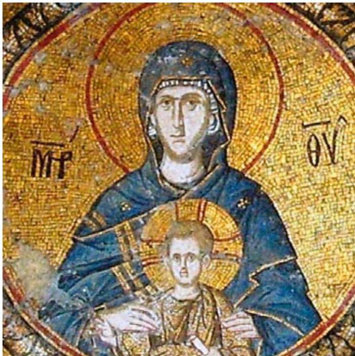
Ἡ Θεοτόκος, τμῆμα ἀπὸ τὴν Γενεαλογία τοῦ Χριστοῦ. Μονὴ τῆς Χώρας, Κωνσταντινούπολη (1315-1320)

πολύτιμο συνάλληγμα. Κάθε δολλῆριο ποὺ ἀφήνετε