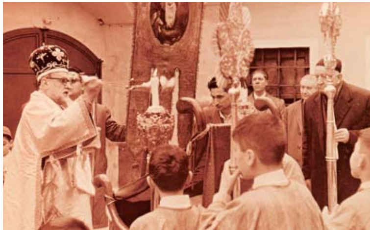
Ὁ Ἐπίσκοπος Ἀργυρουπόλεως Καθλινίκος κατὰ τὴ τελετὴ τῆς Ἀναστάσεως.

Κοίταξα γύρω. Ἡ Τασούλα ἀκόμη νὰ φανεῖ. Ὁ ψάλτης