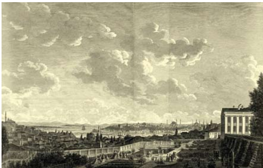
Άποψη τής Κωνσταντινούπολης από τους κήπους του Palais de France Γκραβούρα του Γάλλου κόμη ντε Σουαζέλ Γκουφιέ, τέλη 18ου αί.

Όλοι όμως ξέρουν πώς όλα είναι εκεί, όλα είναι εκεί