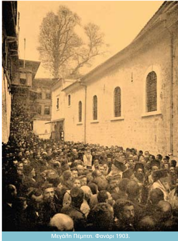
Μεγάλη Πέμπτη. Φανάρι 1903.

Ἔτσι, ἀνήμερα τῆς Ἁγίας Παρασκευῆς, ἔφυγα κι ἐγὼ ἀπὸ τὰ Θεραπεῖα «πετώντας», παίρνοντας γιὰ ἀντίδωρο τὴ ζωντανὴ ἱστορία, καὶ γύρισα νὰ συνεχίσω τὶς ἀσκήσεις ἐπὶ χάρτου. Τίποτα ὅμως πιά δὲν θὰ θύμιζε τὴ σκόνη παλιῶν βιβλίων ποὺ εἶχα ἀφήσει πίσω τὸ πρωί. ■