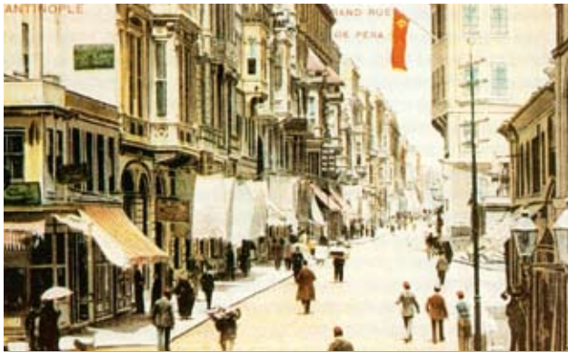
Ἡ Μεγάλῃ Ὁδός, ἐπίκεντρο τῆς ἑλληνικῆς παρουσίας, στὴ συνοικία τοῦ Πέρα

Αὐτὴ ἡ διάχυτη, ἀπὴρ σχεδὸν καὶ σαρκωμένη στοὺς τοίχους καὶ στὶς πέτρες τῆς πνευματικῆς ἀτμόσφαιρα, ἀπόρ-