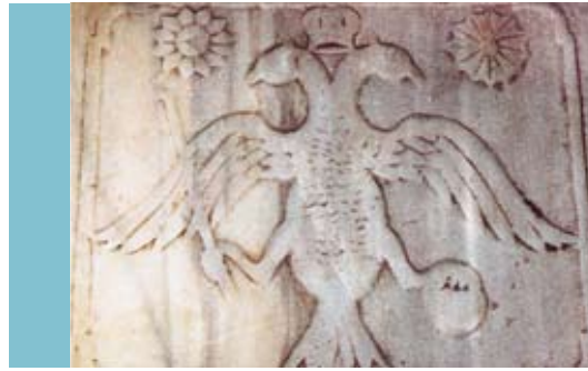
Ἀνάγλυφος δικέφαλος αἰετὸς στὸ δάπεδο τῆς ἐκκλησίας τῆς «κατὰ τὸ Σαλήμ-τομπρούκι Θεοτόκου».

Ὁ Ἑλληνισμὸς ἄντεξε γιὰ πολλοὺς αἰῶνες στὶς συνθήκες σχεδὸν ὀλοκληρωτικοῦ ἀφανισμοῦ λόγω τῆς πολιτισμικῆς του παράδοσης ποὺ στηριζόταν στὴν ἐκκλησιαστικὴ του παράδοση.