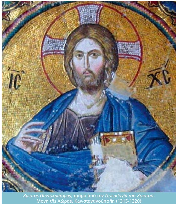
Χριστὸς Παντοκράτορας, τμήμα ἀπὸ τὴν Γενεαλογία τοῦ Χριστοῦ. Μονὴ τῆς Χώρας, Κωνσταντινούπολη (1315-1320)

Ἀρχιτεκτονικὴ, ἱστορία, ἐκκλησία, μάρμαρα (σὰν τὰ μάρμαρα τῆς Πόλης, ποῦναι στὴν Ἁγία-Σοφία...), σελίδες δόξης, εὐκλείας, σελίδες βανδαλισμῶν, πόνου,