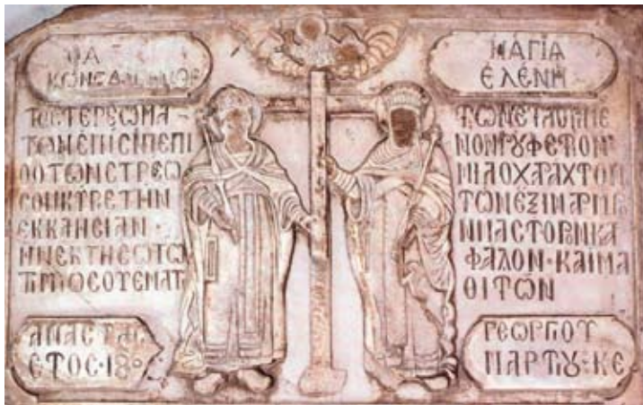
Ἐπιγραφή στὸ ὑπέρθυρο τῆς κεντρικῆς πύλης τοῦ ἱεροῦ ναοῦ Ἁγίου Κωνσταντίνου τῆς Καραμανίας, μῆνιμα τῆς ἐκ βάθρων ἀνακατασκευῆς τοῦ 1804.

στὰ κελεύσματα τῶν μηχανισμῶν παραποίησης τῆς ἱστορίας. Εἶναι ἀρκετὰ τὰ παραδείγματα ποὺ μὴ-μόνιμα μέλη ΔΕΠ βρίσκονται ἐκτὸς Α.Ε.Ι. ἂν δὲν γράφουν κατὰ παραγγελία ἱστορία μὲ τὴν κατηγορία ὅτι εἶναι «ἀκραῖοι» καὶ δὲν ἔχουν ἐπιστημονικὴ ἐπάρκεια. Ἐπίσης εἶναι ἐντυπωσιακὸ νὰ βλέπει πῶς λειτουργοῦν οἱ μηχανισμοὶ τῆς παραποίησης τῆς ἱστορίας μὲ τὴν προώθηση αὐτῶν ποὺ