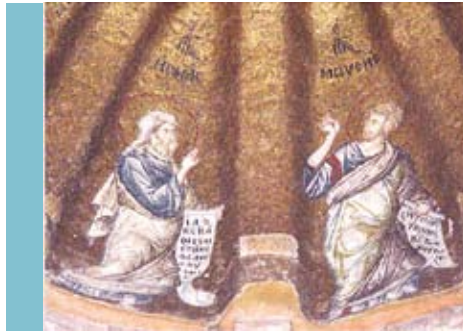
Προπύλαρες τοῦ Χριστοῦ, Μονὴ τῆς Χώρας.

Ἀρχιτεκτονική, ἱστορία, ἐκκλησία, μάρμαρα, σελίδες δόξης, εὐκλείας, σελίδες βανδαλισμῶν, πόνου, δακρύων. Μισοτελειωμένη λειτουργία, ψηφιδωτὰ ἀπαράμιλλα, περασμένα μεγαλεῖα.