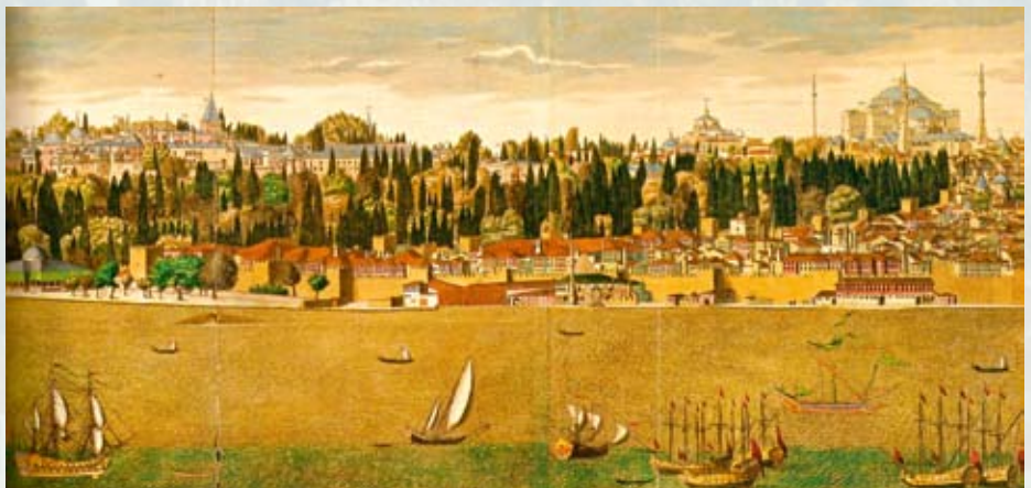
Ἀποψη τῆς Κωνσταντινούπολης Ἰστογραφία τοῦ Cosimo Commidas (1780).

Ἐὰν ὁ σουλτάνος Μωάμεθ ἦταν λιγότερο ἀποφασιστικός, ἢ ὁ Χαλήλ πασᾶς περισσότερο πειστικός, ἢ ἐὰν ἡ βενετσιάνικη ἀρμάδα εἶχε ἀποπλεύσει δεκαπέντε ἡμέρες νωρίτερα, ἢ ἐὰν κατὰ τὴν τελευταία κρίση ὁ Τζουστινιάνι δὲν εἶχε τραυματισεῖ στὰ τείχη καὶ ἡ παράπλευρη πύλη τῆς Κερκόπορτας δὲν εἶχε μείνει μισάνοικτη, μακροπρόθεσμα λίγα θὰ εἶχαν ἀλλιάξει. Τὸ Βυζάντιο ἴσως θὰ εἶχε ἐξακοιουθήσει νὰ ὑφίσταται γιὰ μία ἀκόμη δεκαετία