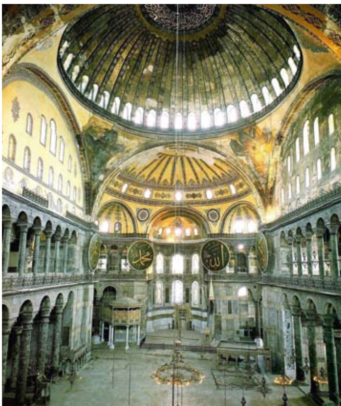
Ἀποψη τοῦ ἐσωτερικοῦ χώρου τῆς Μεγάλης Ἐκκλησίας