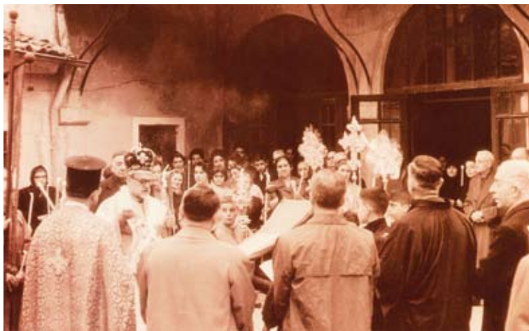
Ἀνάσταση στὸν αὐλόγυρο τῆς Μουχλιώτισσας. Πάσχα τοῦ 1963.

Κάποτε ὁ αὐτοκράτορας Ἀντωνίνος ἄκουσε πὼς ἡ Παρασκευὴ διδάσκει γιὰ τὴν ἔλευση τοῦ ἐνὸς καὶ μοναδικοῦ ἀληθινοῦ Βασιλέα, κι ἐκεῖνος φοβήθηκε πὼς θὰ τοῦ πάρει τὸ θρόνο. Ἔτσι διέταξε νὰ συλληφθεῖ ἡ γυναίκα αὐτὴ καὶ νὰ θανατωθεῖ. Ζήτησε νὰ βράσουν ἰάδι καὶ νερό καὶ νὰ τὴ