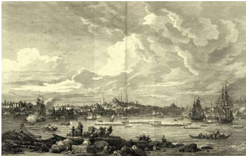
Γενικὴ ὄψις τοῦ λιμανιοῦ τῆς Κωνσταντινούπολης Γκραβούρα τοῦ Γάλλου κόμη de Choiseul Gouffier, τέλη 18ου αἰ.

Ἄλλα γυμνά, γδαρμένη τοικοδομὴ σὲ βάθος, προδοτικὰ ἡμίγυμνος ὁ σταυρόσχημος διάκοσμος, ἓνα σπάργανο μωσαϊκοῦ ἀντιστέκεται μόνον τοῦ στὴν ἀψίδα τοῦ