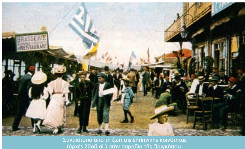
Στιγμιότυπο ἀπὸ τὴ ζωὴ τῆς ἐλληνικῆς κοινότητας (ἄρχες 20οῦ αἰ.) στὴν παραλία τῆς Πριγκήπου

γκαλιος, πανίσχυρος, ριζωμένος κι αἰώνιος. Ἀλλοιῶς, πῶς νὰ χωρέση ἡ καρδιά σου τὸν ἔκπαγλο τῆς τοῦ Χριστοῦ Σοφίας ναὸ καὶ τὴν μικρὴ κατακόμβη τοῦ ἀγιάσματος τῆς ἁγίας Παρασκευῆς, στὴν Παναγιά τὴν Χατζηριώτισσα, καὶ νὰ δοξάση τὸν Ὑψιστο γιὰ τὸ εὐτελεστάτο τενεκεδένιο κανδηλάκι πού εἰσέτι σιγοκαίει μπροστὰ στὸ εἰκόνημα τῆς παρθενομάρτυρος; Πῶς νὰ τὸ πῶ; Πεθαίνεις καὶ ξαναγεννίεσαι σὲ τούτη τὴν πόλη. Γδέρνεσαι. Δέκα φορές τὴν ἡμέρα πεθαίνεις καὶ ξαναγεννίεσαι. Μυσταγωγική πολὺχρονη μύσις ἀπὸ τὴν ὁποίαν ἀναδύεσαι Κωνσταντινουπόλιτης. Ἐλλήνη ἐν ἑτέρᾳ μορφῇ. Σταυρικός μαζὶ καὶ ἀναστάσιμος. Δίχως τὴν ψευδαίσθηση τῆς ἰσορροπίας, τῆς ἐπιτεύξεως τῆς οἰασθήποτε ἰσορροπίας, ἀλλὰ τραγικός ὁμοῦ καὶ