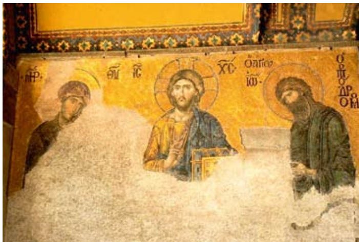
Ἡ Δέσσις Ψηφιδωτὸ στὴν Ἁγία Σοφία (1261)

Ἄγνοοῦν ἐντελῶς, ἂν ὑπάρχη γηροκομεῖο, νοσοκομεῖο, φρενοκομεῖο, συσσίτια. Ἄγνοοῦν ὅτι ὑπάρχει ἀνά-