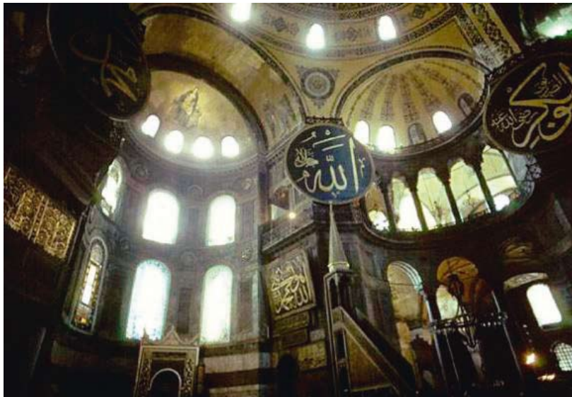
Ἐπιμέρους ἄποψη τῆς σημερινῆς μορφῆς τῶν ἀψίδων τῆς Ἁγίας Σοφίας

Αὐτὴ ἡ Πόλη δὲν ἀρνεῖται. Κι ἐσὺ δὲν τὴν θέλεις πιά, δὲν τὴν θέλεις ἔτσι, κι ἄς ἐπενδύεται ἡ ὑποταγμένη σου διαφορετικότητα ὅλες τῆς τῆς θρησκευτικῆς καὶ τῆς ἐθνικῆς ἐξάρσεις κι ἄς ὀπλιζέται τῆς ἰδεολογίας τῆς κι ἄς ἐτοιμάζεται γιὰ μάχες καὶ συγκρούσεις. Αὐτὴ ἡ Πόλη δὲ σὲ θέλει. Ἡ σκέψη σου ἀρνεῖται πιά νὰ συνεχίσει πρὸς τὰ πάνω, πρὸς ὅσα τῆς ὑπόσχεται ὁ θόλος. Θὲς νὰ φύγεις μακριά. Ἀλλὰ πρέπει, λένε, νὰ συνεχίσεις, νὰ δεῖς τὰ ψηφιδωτὰ ποὺ ἀποκαλύπτει στὸν πάνω ὄροφο ἡ ἀρχαιολογικὴ «ἐξεύνα» ἐν ὀνόματι κάποιου παγκόσμιου πολιτισμοῦ (καὶ πάντως, στὸ φονταμενταλιστικὸ μεταίχμιο τῶν διεθνικῶν τουριστικῶν ἀναγκῶν