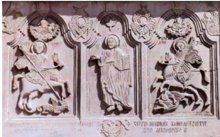
Ανάγλυφη πλάκα στὸν περιβολὸ ἱεροῦ ναοῦ Ἁγίου Γεωργίου τοῦ Ποταρᾶ. 6 Δεκεμβρίου 1830.

ἐξασθένησε τὴν ἠθικὴ ἄμυνα τοῦ γένους. Ἀκόμα καὶ ἡ «Μεγάλῃ Ἰδέα», ὡς ἡ ἑλληνικὴ ἔκδοση τοῦ δυτικοφερμένους ἰδεολογίας τοῦ ἔθνους-κράτους, ποὺ προτάθηκε ἀπὸ τὸν ἀρχηγὸ τοῦ φιλογαλλικοῦ κόμματος Ἰ. Κωλέττη τὸ 1844 ἀποτελεῖ τὸ ἰδεολόγημα τοῦ παλαιοκομματικοῦ συστήματος νὰ χρησιμοποιεῖ τὸν ἀλύτρωτο ἑλληνισμὸ σὺς ἐξωτερικὲς πολιτικὲς ἔριδες γιὰ κομματικὰ ὀφέλη. Ἡ