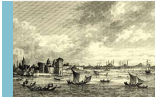
Τα άνακτορα καί οι έπτά πύλοι τής Κων/πόλης από τήν Προποντίδα