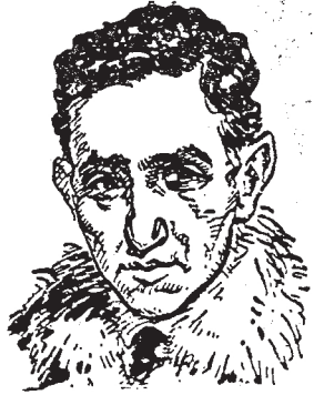
Ὁ (Ἑβραῖος Κάτε) ΚΑΜΚΩΦ μέλος τῆς Κέν- τρικῆς Ἐκτελεστικῆς Ἐ- πιτροπῆς τῶν Σοβιέτ.