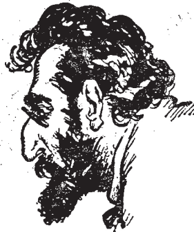
Ὁ (Ἑβραῖος Τσιδεμπά- ουμ) ΜΑΡΤΩΦ, μέλος τοῦ Κεντρικοῦ Ἐκτελεστικοῦ Κομιτάτου.

Τέλος καὶ ὁ Θεὸς ἐλεησάτω πάντα ἄνθρωπον.