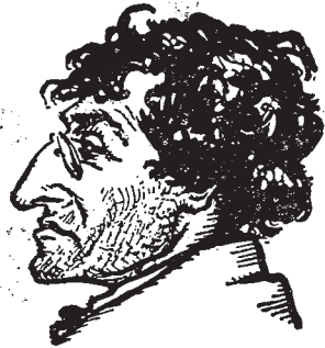
Ὁ Ἑβραῖος ΑΒΑΝΕΣΩΦ Γραμματεὺς τοῦ Πολιτι- κοῦ Γραφείου.