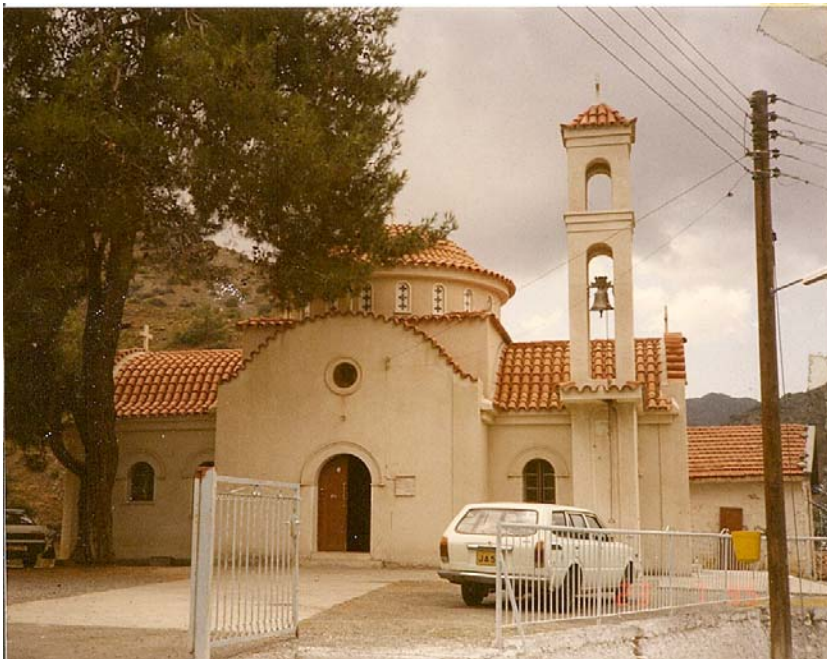
Ο ΝΑΟΣ ΤΩΝ ΑΓΙΩΝ ΣΤΟ ΑΠΛΙΚΙ ΠΙΤΣΙΛΙΑΣ