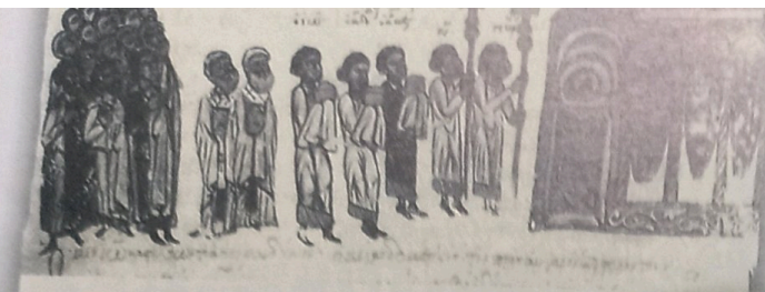
Λιτανεία στην Κωνσταντινούπολη. Μικρογραφία από τον κώδ. Matritensis