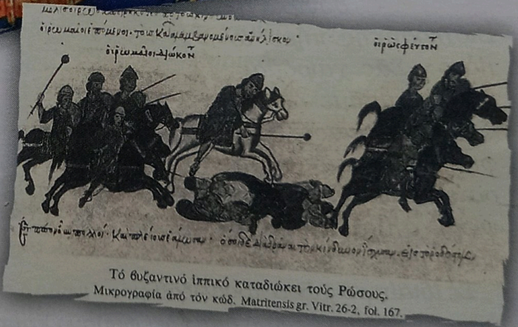
Τό βυζαντινό ἰπικό καταδιώκει τούς Ρώσους. Μικρογραφία ἀπό τόν κώδ. Matritensis gr. Vitr. 26-2, fol. 167.

18 Ἰουνίου 860. Οἱ Ρῶσοι μέ πλοῖα καί στρατό πολὺ ἐπιέδηκαν κατά τῆς Κωνσταντινούπολης, ἐνῶ ὁ αὐτοκράτορας Μιχαήλ Γ' ἀπουσίαζε μέ τὸ στρατό σέ ἐκστρατεία κατά τῶν Ἀράβων. Ληληλάτησαν τὰ προάστια καί διέπραξαν ἄγριες σφαγές. Ὑποχώρησαν ὅμως ἐπειδὴ ὁ στόλος τους καταστράφηκε ἀπό φοβερὴ θαλασσοταραχὴ, πού ἀποδόθηκε σέ θαῦμα τῆς Θεοτόκου. Ὁ Πατριάρχης Φώτιος* ἐκφώνησε τότε δύο ὁμιλίες, τὴν πρώτη κατὰ τὴ βαρβαρικὴ ἐπιδρομὴ καί τὴ δεύτερη μετὰ τὴν πανωλεθρία τους. Παραθέτουμε ἀποσπάσματα ἀπὸ τίς παραπάνω ὁμιλίες του 1 .