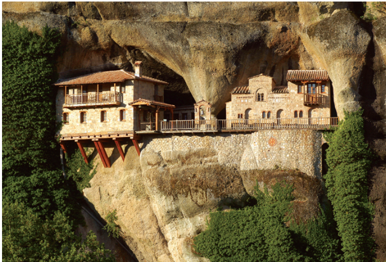
Ίερά Μονή Ὑπαπανθῆς, Ἁγίων Μετεώρων