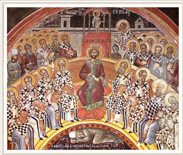
Ἡ πρώτη Οἰκουμένη Σύνδος πού κατεδίκασε τόν ἀρειανισμό