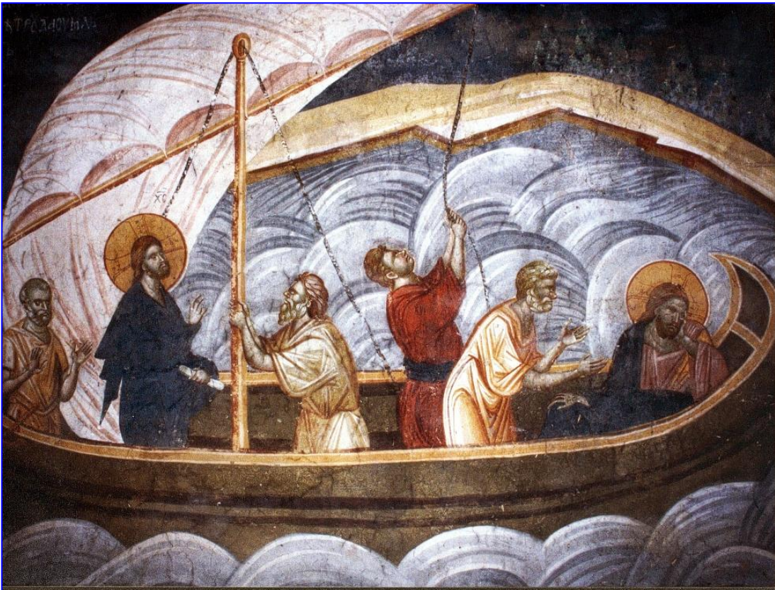
Ἐκ τοῦ περιοδικοῦ «Ρίζες»