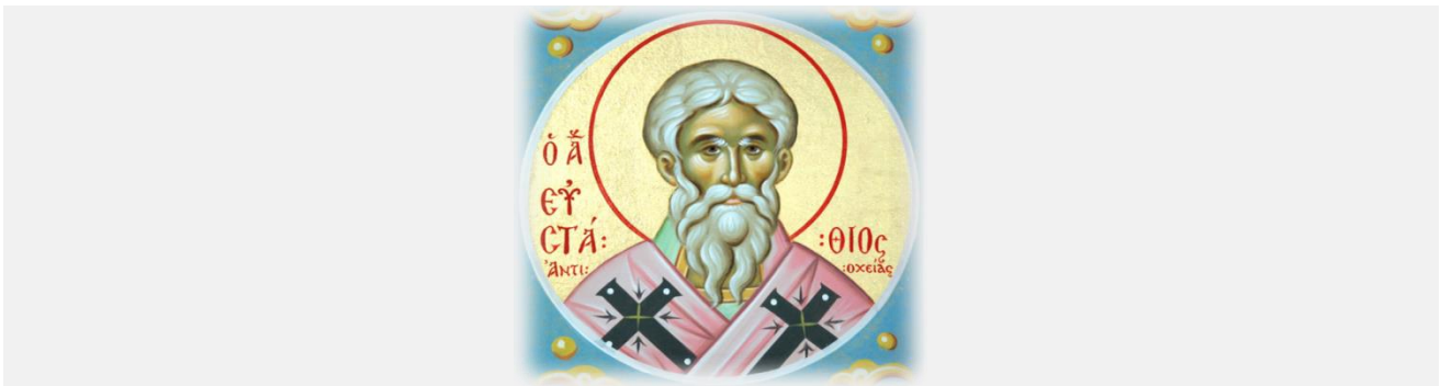
Εορτάζει 21 Φεβρουαρίου

Στον επισκοπικό θρόνο της Αντιόχειας κάθισαν, εκτός από τον Παυλίνο, και οι αρειανόφρονες Ευλάλιος, Ευφρόνιος, Πλάκτης (συναντάται επίσης και ως Φλάκτιος, Φλάκιλλος, Πλάκιλλος και αλλιώς), Στέφανος, Λεόντιος και Ευδόξιος, με τους οποίους οι «Ευσταθιανοί» όπως είπαμε δεν είχαν καμία κοινωνία. Βρίσκονταν δηλαδή σε σχίσμα 7 και έτσι η Εκκλησία της Αντιοχείας ήταν διαιρεμένη σε δύο μερίδες.