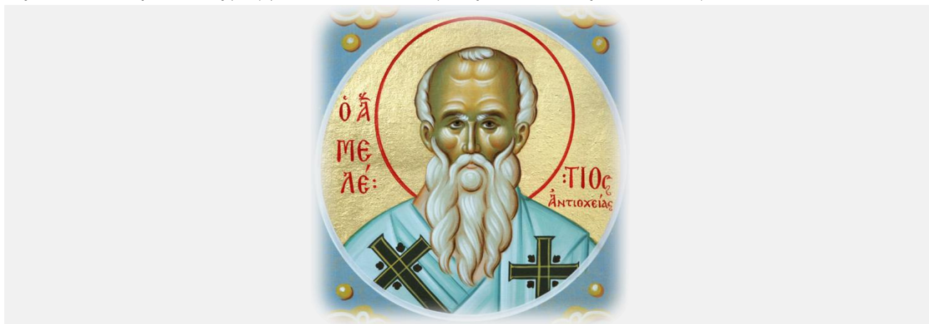
Εορτάζει 12 Φεβρουαρίου

Με την ανάκληση από την εξορία του Αγίου αναμενόταν αίσιο τέλος και άρση τουλάχιστον του διχασμού του ορθοδόξου πληρώματος της Αντιοχείας («Ευσταθιανών» και «Μελετιανών»), για την οποία έλαβε ειδική μέριμνα, όπως θα δούμε, η Σύνοδος της Αλεξάνδρειας.