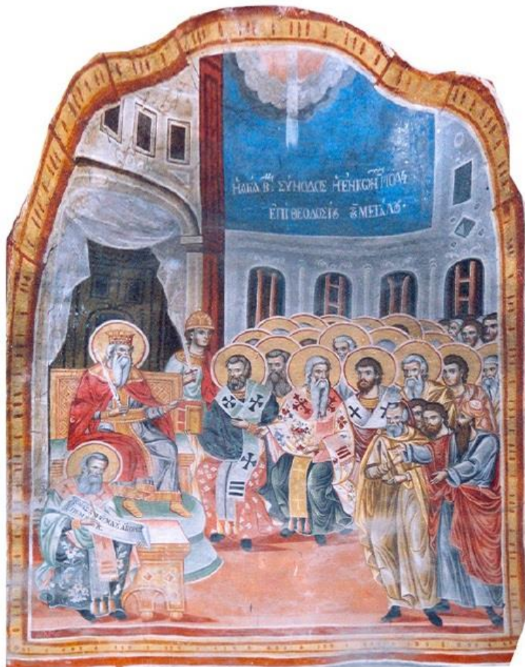
33. Η Β Οικουμενική Σύνοδος στο νάρθηκα του παρεκκλησίου του Αγίου Νικολάου της Ι. Μ. Βατοπαιδίου (1803).

Η πρότασή του δεν έγινε δεκτή και η Σύνοδος εξέλεξε ως επίσκοπο Αντιοχείας τον Φλαβιανό με ομόφωνη συνοδική απόφαση.