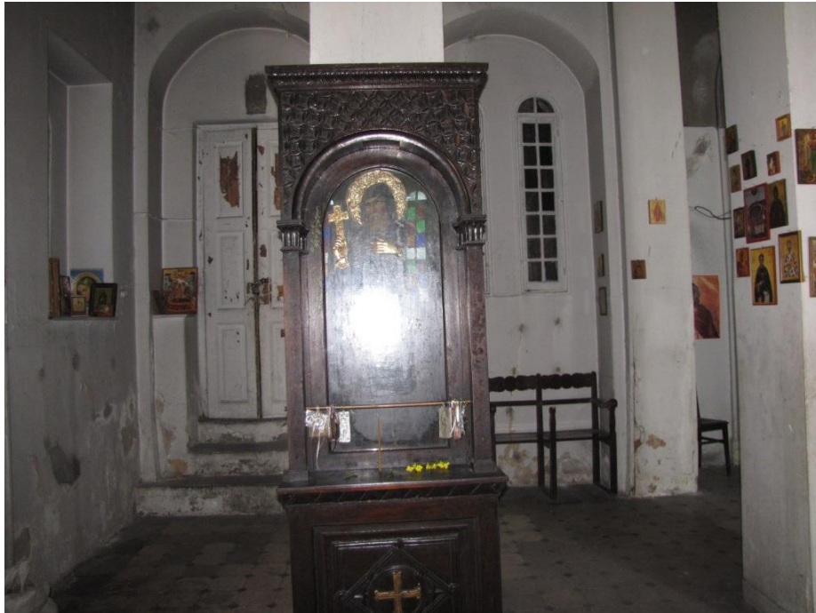
Εικόνα του Αγίου Μελετίου Αντιοχείας στην παλιά εκκλησία του αγίου στα Σεπόλια Αθηνών

Στις 17 Φεβρουαρίου του 364 πέθανε ο Ιοβιανός και αυτοκράτορας του ανατολικού τμήματος της Ρωμαϊκής Αυτοκρατορίας ανακηρύχθηκε ο Ουάλης (αρχικά ορθόδοξος, έπειτα αρειανός) 30 . Νέοι διωγμοί πλέον ανέμεναν τους γνησίους ορθοδόξους.