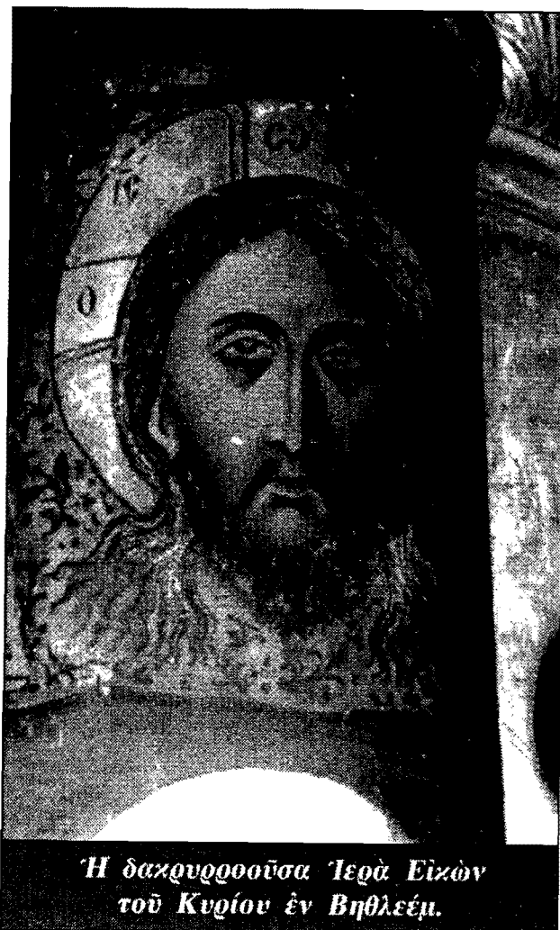
Ἡ δακρυροοῦσα Ἱερὰ Εἰκὼν τοῦ Κυρίου ἐν Βηθλεέμ.

Ἐκάλεσα ὑμᾶς καὶ εἶπον: «Δεῦτε πρὸς με πάντες» καὶ σῶζεσθε. (Ματθ. ια', 28). «Δικαιοσύνην μάθετε οἱ ἐνοικοῦντες ἐπὶ τῆς γῆς»· «πᾶς ὃς οὐ μὴ μάθῃ δικαιοσύνην ἐπὶ τῆς γῆς, ἀλήθειαν οὐ μὴ ποιήσῃ» (Ἠσ. κατ', 9-10)· «ρῦσασθε ἀδικούμενον» (Ἠσ. α', 17). «Καὶ οὐ θέλετε ἐλθεῖν πρὸς με, ἵνα ζωὴν ἔχητε»! (Ἰωάν. ε', 40). «Ἴδου ἀφίεται ὑμῖν ὁ οἶκος ὑμῶν ἔρημος»! (Ματθ. κγ', 38).